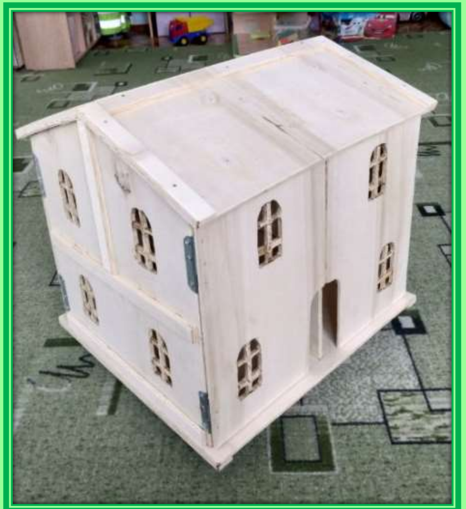
Домик для кукол